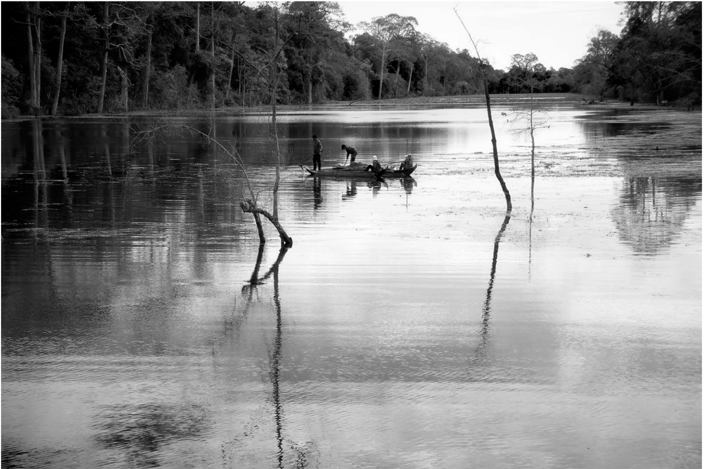
Embarqués sur les douves d'Angkor Thom