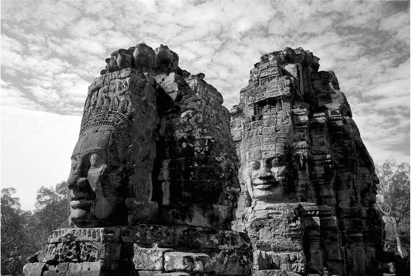
Sérénité au Bayon