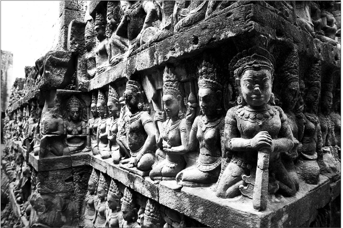
Révélation du mur caché