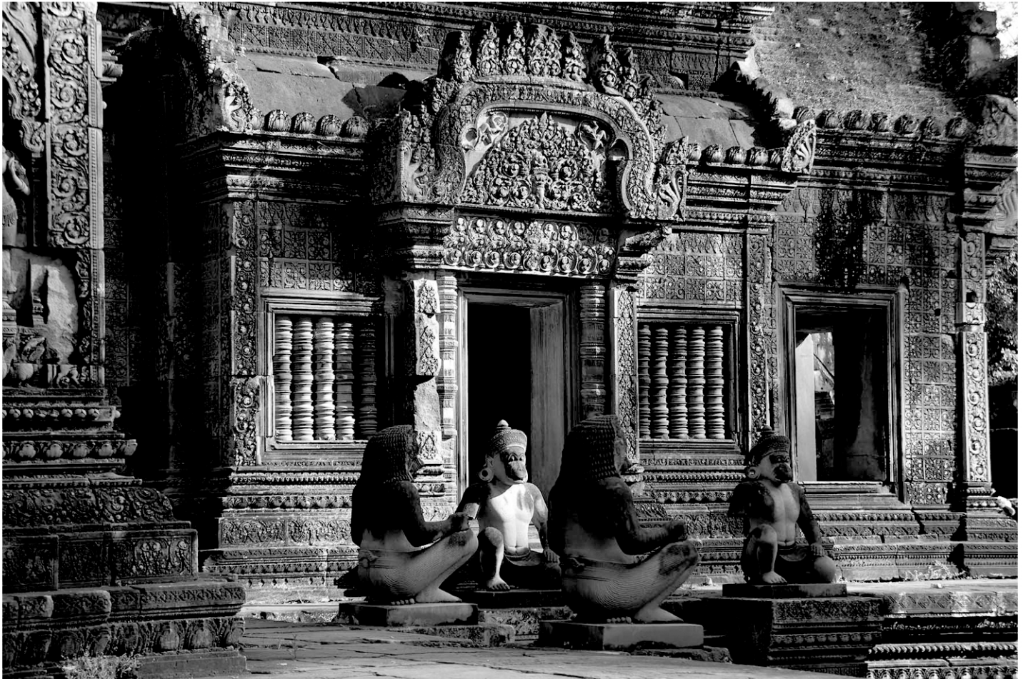
Méditation au Banteay Srei