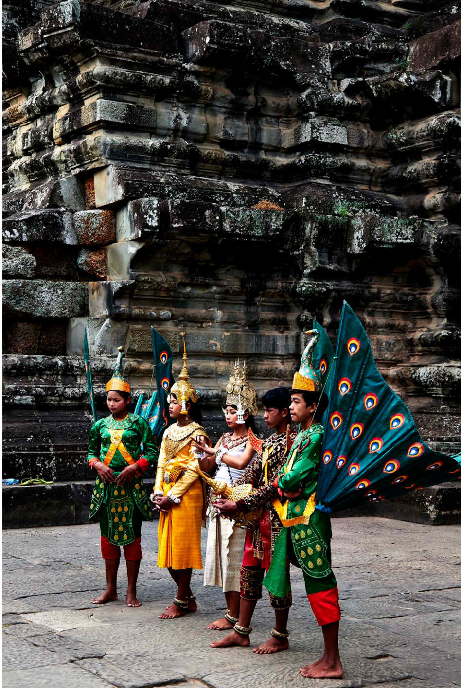
Costumes à Angkor Vat