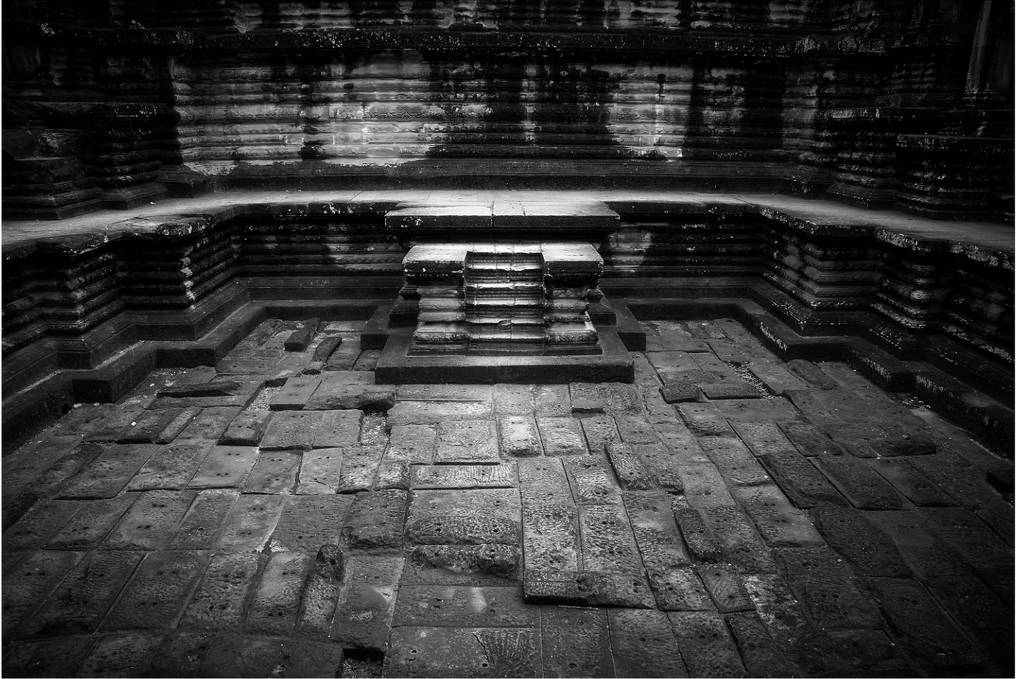
Mystique Angkor Vat