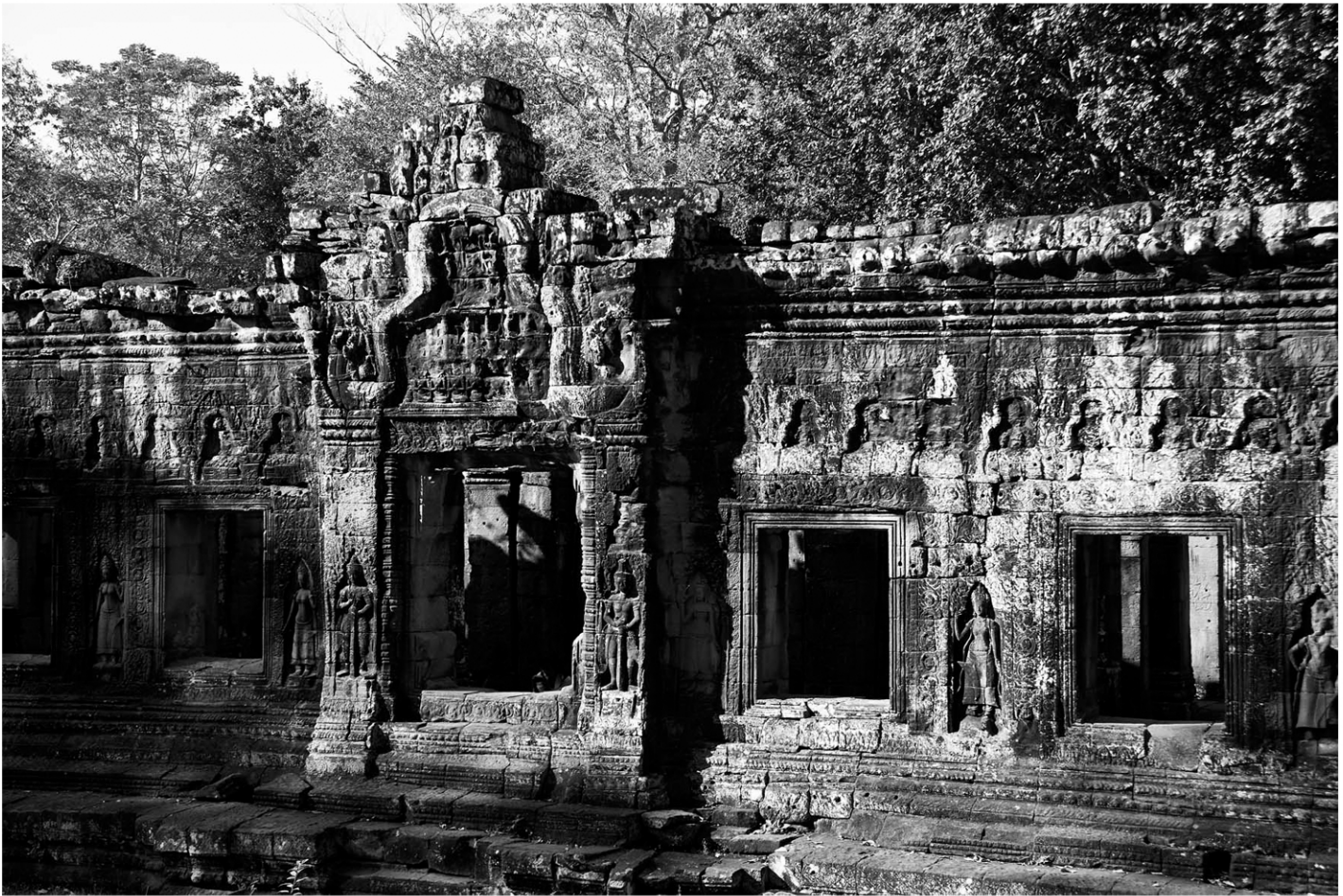
Lumières sur le Banteay Kdei